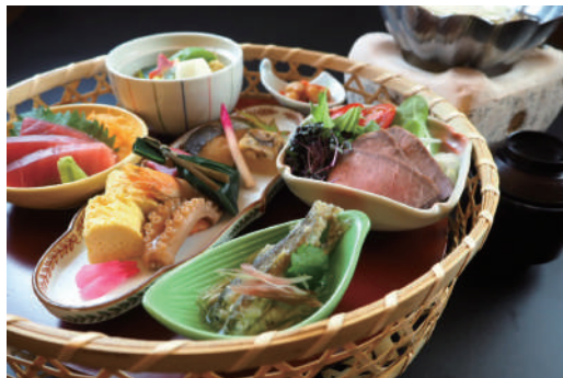
ご昼食 里山かご弁当