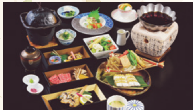
瑠璃会席 (入浴料込/入湯税別) 6,600円