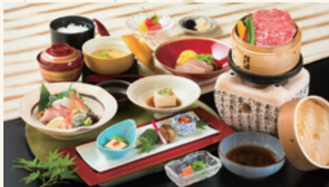
近江牛せいろ蒸し会席 (入浴料別/入湯税別) 5,500円