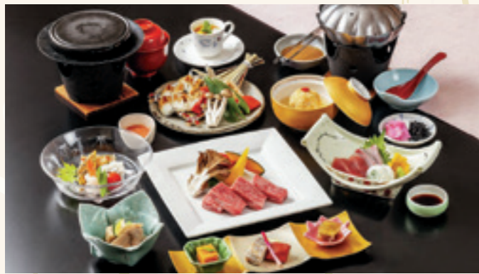
近江牛ステーキ会席 (入浴料込/入湯税別) 8,800円