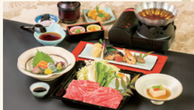
近江牛しゃぶしゃぶ御膳 (入浴料別/入湯税別) 5,500円

※お食事場所のご利用は11:30～14:00となります。 ※ご予約は10名様以上でお申し込みください。 ※表示金額は税込です。 ※季節により内容は変わります。