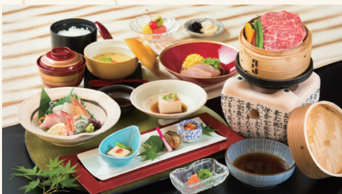
近江牛せいろ蒸し会席 (入浴料別/入湯税別) 5,500円