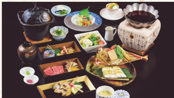
瑠璃会席 (入浴料込/入湯税別) 6,600円