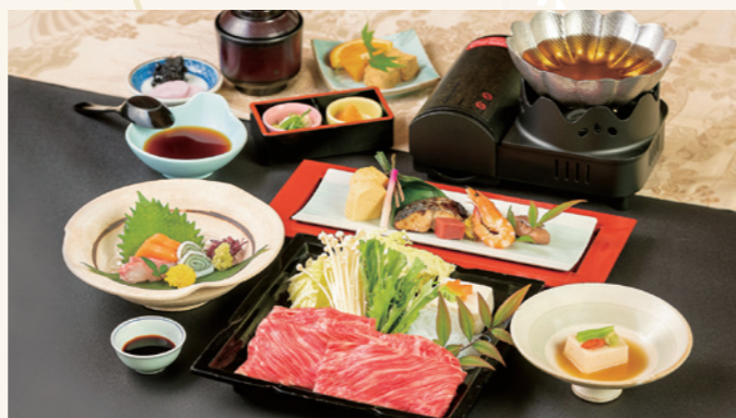
近江牛しゃぶしゃぶ御膳 (入浴料別/入湯税別) 5,500円

※お食事場所のご利用は11:30~14:00となります。 ※ご予約は10名様以上でお申し込みください。 ※表示金額は税込です。 ※季節により内容は変わります。