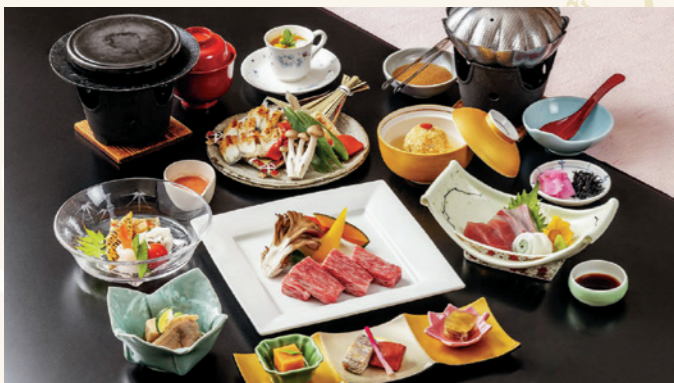
近江牛ステーキ会席 (入浴料込/入湯税別) 8,800円